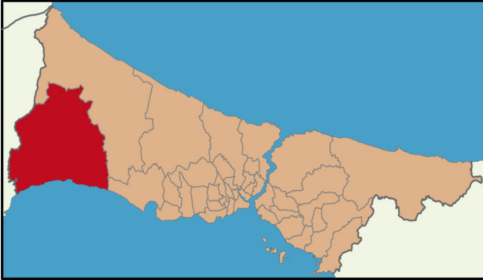
SİLİVRİ ATATÜRK ANADOLU LİSESİ